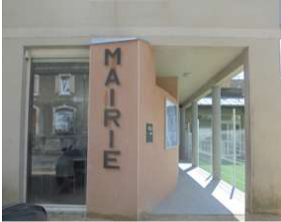
Façade de la mairie