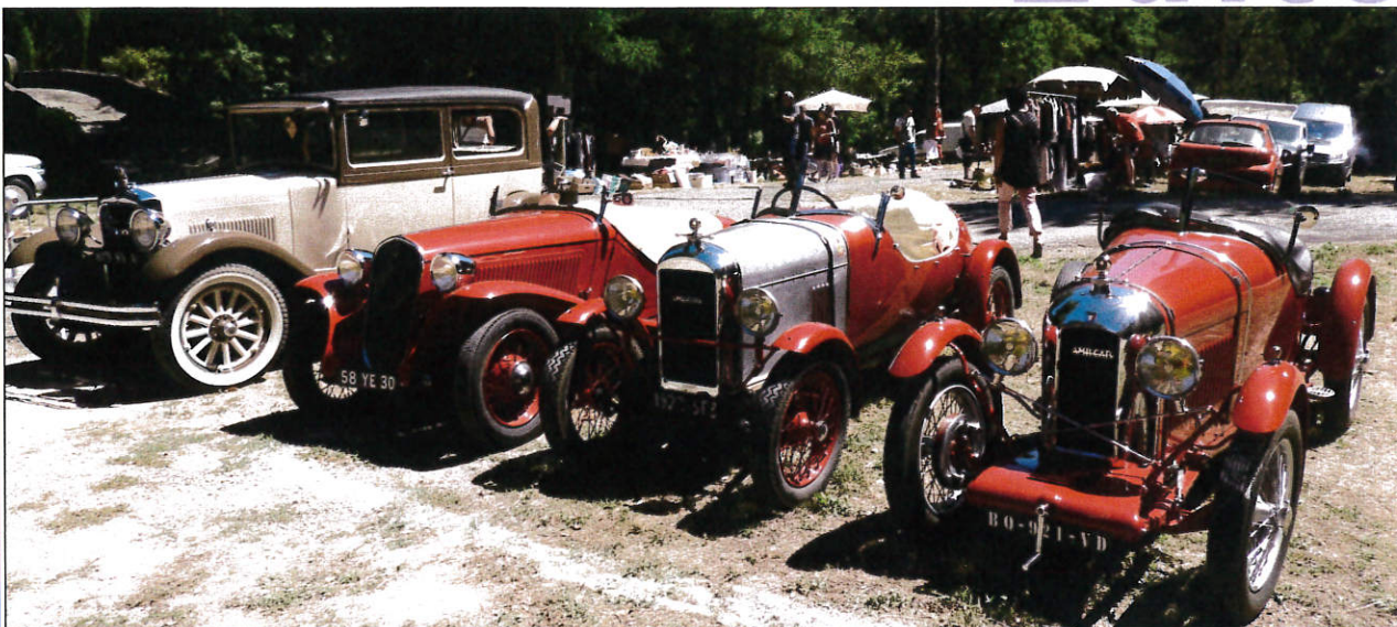
La fête Autos-Motos-Vélos-Rétro a été un succès encore une fois cette année !!

Nous avons eu chaud, oui très chaud, la pluie s'est faite rare et les réserves d'eau ont bien diminué malgré les restrictions que vous avez tous respectées.